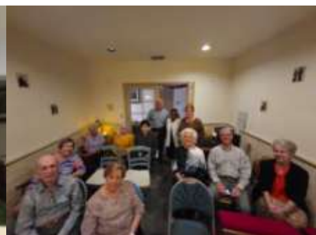
Mesa Redonda en inglés